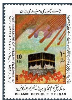
1987.3 Iran Incident with pilgrims (Ausgabe 1988)