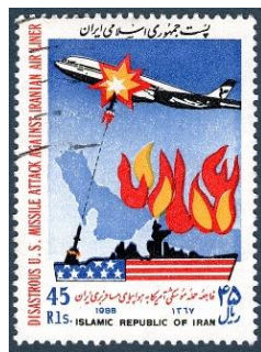
1987.2 Iran anti-USA. (Ausgabe 1988)