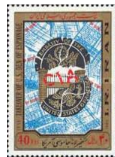
1987.4 Iran anti USA-CIA (Ausgabe 1985).