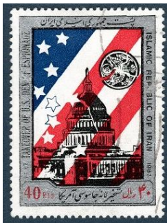
1987.1 Iran anti-USA. (Ausgabe 1987)

Kuwait also took offence when her authorities discovered such Iranian stamps on transit mail. UPU rules did not permit a refusal, therefore Kuwait blacked these stamps on transit mail which was subsequently sent on.